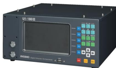
UI-180 III探傷器 / UI-180 III Flaw Detector

システム構成は被測材料を確実に固定できる計測機構と精密厚さ計測機能を持ったUI-180 IIIにより構成されます。 注) 計測機構はユーザにて製作