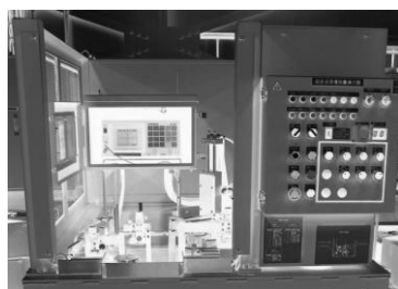
測定機構（ユーザ製作範囲） / Measurement mechanism (user made)