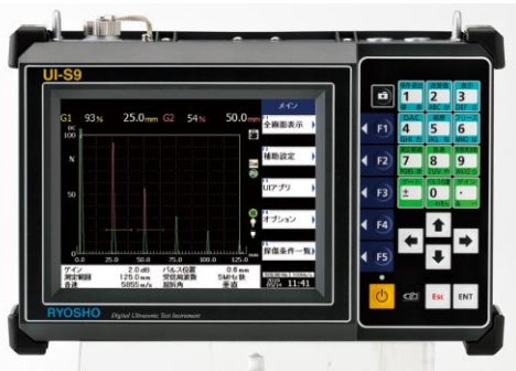
UI-S9:スタンダードモデル

超音波探傷器ご購入を検討されている方必見です!! お得な特典をお付け致します。 ぴったりな特典をお選びください。 この機会にぜひ新規ご購入の検討をお願い致します。