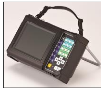
③ソフトケース&ハンドストラップ