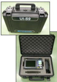
①キャリングケース