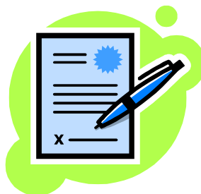
修理依頼書(必要事項をご記入下さい。)